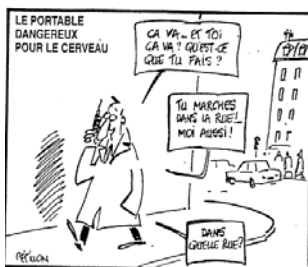
Dans Le Canard enchaîné du 27 octobre, par Pétillon